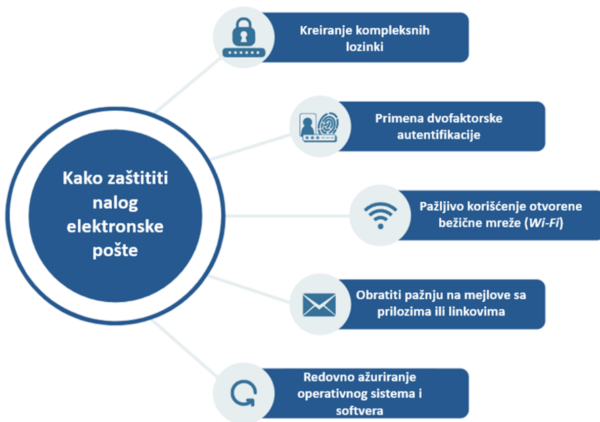
Slika 2 - Koraci zaštite naloga elektronske pošte